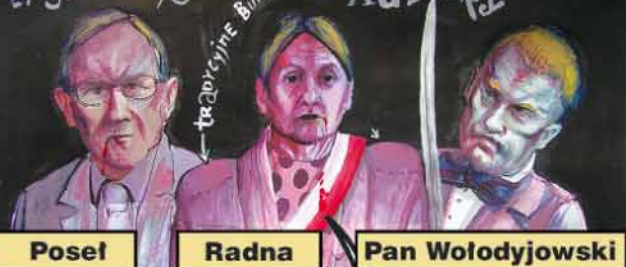
Posel Radna Pan Wołodyjowski